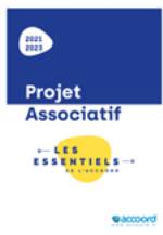
Le projet associatif Les Essentiels