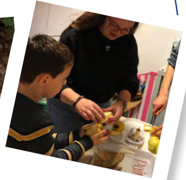
Goûters faits Maison et de saison