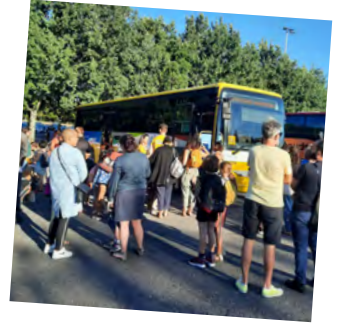
Séjours à l'international