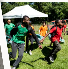
Accueil de loisirs Ados