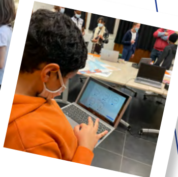
Journée ados numérique