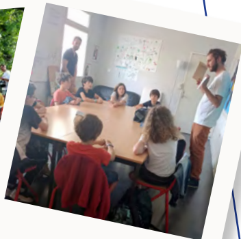
Animation débat dans les collèges