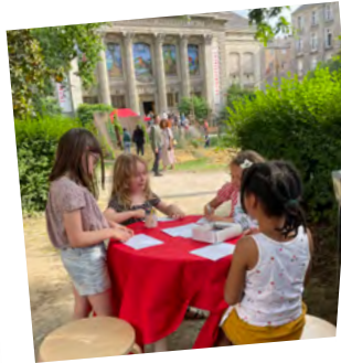
Sorties au musée