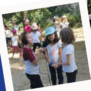
Accueils de loisirs Enfants