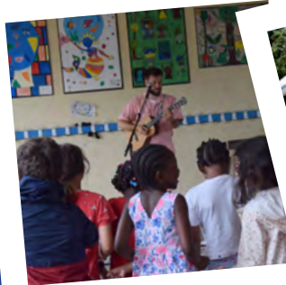
Programmation culturelle dans les accueils de loisirs