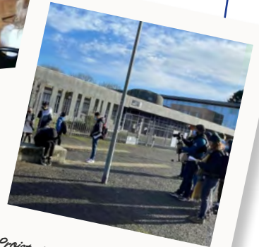
Projet vidéo contre le harcèlement scolaire