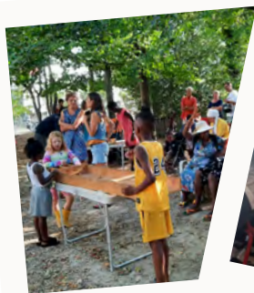
Soirée Familles au CSC