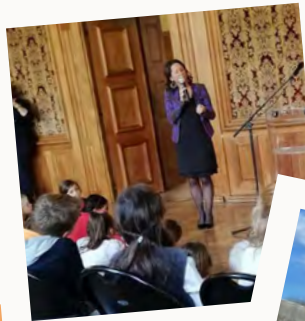
Journée mondiale de l'enfance