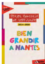
Le PEDT « Bien Grandir à Nantes »