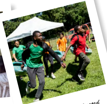
Sport innovant (Nantes Accoord Sport Aventure)