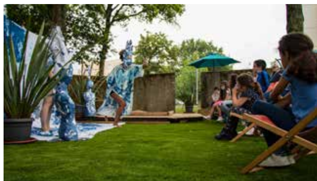
Spectacle de théâtre proposé aux enfants de l'accueil de loisirs du Bout des Landes